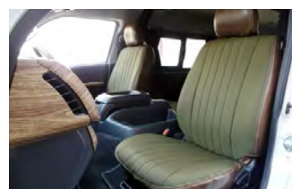
MONOBOX コーデュラカーキ×ヴィンテージレザー調