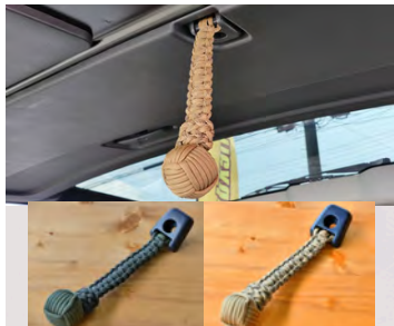
MONOBOX: ハイエース用 パラコード製リアゲートストラップ