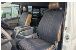
MONOBOX コーデラブラック×ヴィンテージレザー調