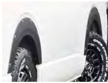
JAOS: フェンダーガーニッシュαtypeX

LEDイルミネーション付き バンパープロテクター 価格: ¥99,000 工賃: ¥22,000