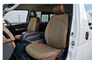
MONOBOX コーデラブラウン×ヴィンテージレザー調