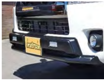
flexdreamバンパープロテクター

LEDイルミネーション付き バンパープロテクター 価格: ¥99,000 工賃: ¥22,000