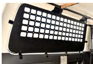
FD:サイドストレージパネル

UIビークル製 ローダウンブロック 1、1.5、2インチから選択。 玄武フロントバンブストップ 玄武リアバンブストップ付 価格: ¥40,480 工賃: ¥22,000 ※構造変更込み