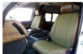
MONOBOX コーデュラカーキ×ヴィンテージレザー調