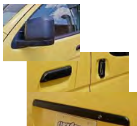
艶消しブラックカバーセット

サイズ 2,500×2,500mm 価格: ¥66,000 ブラケット: ¥16,280 工賃 ¥11,000 設定: 標準ボディー ※取付にはラックやベースキャリアなどが必要です。