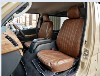
flexdreamシートカバー ヴィンテージブラウン