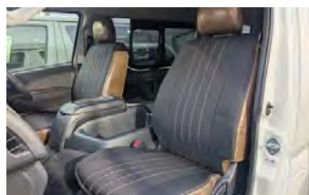
MONOBOX コーデュラブラック×ヴィンテージレザー調