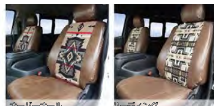
FD-camp ペンドルトン×ヴィンテージレザー調