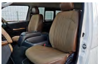
MONOBOX コーデュラブラウン×ヴィンテージレザー調