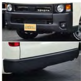
前後バンパー、ステップ