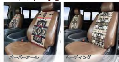
オーバーオール FD-camp ペンドルトン×ヴィンテージレザー調