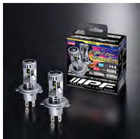
IPF: LEDヘッドランプバルブ

取付簡単なエントリーモデル 「エフェクター」シリーズ ・明るさ重視 6500K: ¥27,500 ・落ち着きのある温白色 4000K: ¥22,000 取付費用込み