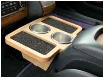
FDコンソールテーブル

クロスライドサイドバー 特注4本脚 2200mm 2本セット ブラック パッケージ変更差額: ¥5,500