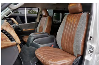
FD-camp ハリスツイード×ヴィンテージレザー調