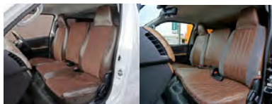
FD-camp コーディネート×ヴィンテージレザー調 FD-camp ハリスツイード×ヴィンテージレザー調

flexdreamオリジナルシリーズの2種類から 変更差額¥33,000で選択可能です。