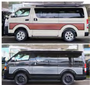
赤目鋼ラッピングシート

★FD-classicコンプリート車両契約時に、ARB製品をご注文頂ければ取付工賃をサービスさせていただきます！