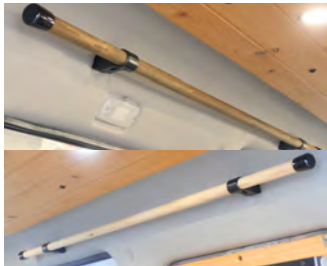
MONOBOXウッドサイドバー

ドリンクホルダー4か所付き 木目調とブラックの2色。 価格: ・S-GL標準ボディ: ¥66,000 ・ワイドボディ: ¥71,500