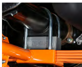
ローダウンセット

取付簡単なエントリーモデル 「エフェクター」シリーズ ・明るさ重視 6500K: ¥27,500 ・落ち着きのある温白色 4000K: ¥22,000 取付費用込み