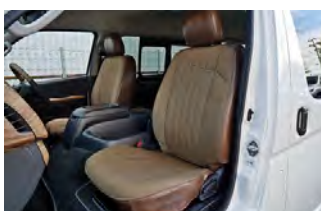
MONOBOX コーデュラブラウン×ヴィンテージレザー調