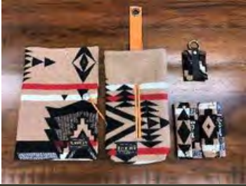
ペンドルトングッズセット

車検証入れ、シートベルト パッド、ティッシュケー ス、キーホルダーのセット 価格: ¥22,000