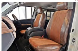
FD-camp コーデロイ×ヴィンテージレザー調