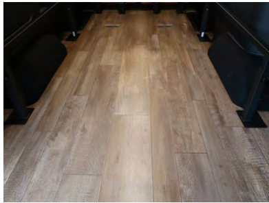
重歩行フローリングフロア

FD-classic 標準装備のサイドバーに 取付するアイテム。着脱し易いノブ ボルト付きのオリジナル仕様。 2本セット 価格: ¥7,700