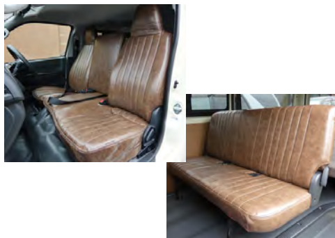
flexdreamシートカバー ヴィンテージブラウン