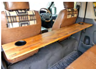
MONOBOX: ワンタッチリアテーブル

重歩行 木目調フロア施工 リアゲートプロテクター付 施工工賃込み ¥143,000-