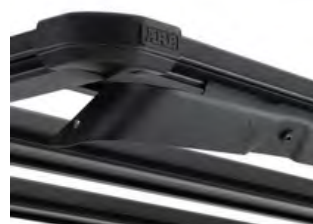
ARB:ウィンドディフレクター

サイズ2,995×1,445mm 価格: ¥385,550 工賃 ¥33,000 設定: 標準ボディー