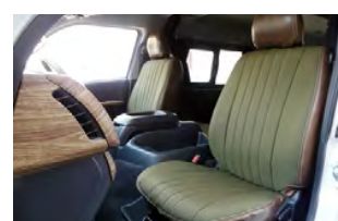
MONOBOX コーデラカーキ×ヴィンテージレザー調