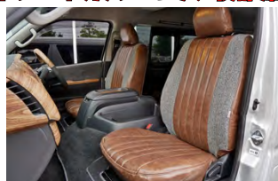
FD-camp ハリスツイード×ヴィンテージレザー調