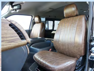
flexdreamシートカバー ヴィンテージブラウン