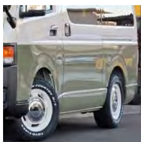
ツートンペイント