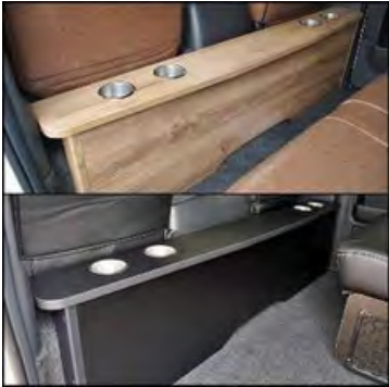
デッキカウンター

ベージュチェック柄 黒チェック柄がございま す。 価格: ・S-GL 2列分: ¥14,300 ・ワゴンGL: ¥35,200