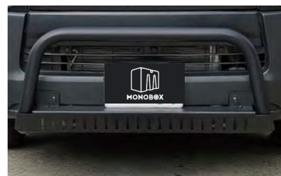
FD:フロントブッシュバー

FD:サイドパネル 設定: ハイエース (ワイド・ナロー) ※スーパーロング不可 価格: ¥110,000 取付工賃: ¥22,000