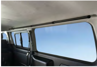
クロスライドサイドバーブラック

1300mm 2本セット セット内容 (サイドバー2本・脚4セット・ボルト4本) ※2カラー展開 オーク または ナチュラル パッケージ変更差額: ¥11,000