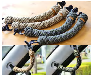
MONOBOX: ハイエース用 パラコード製アシストグリップ2本SET

MONOBOX×ヒミツキチガレージ とのコラボ商品となります。ハイエ ースに、足元の自由と快適性を。 価格: ¥55,000 設定: S-GL標準ボディ