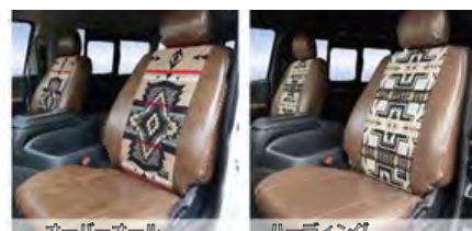
FD-camp ペンドルトン×ヴィンテージレザー調