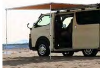
ARB:サイドオーニング

JAOS製のオーバーフェンダー マットブラック塗装済み ¥85,800 工賃 ¥22,000