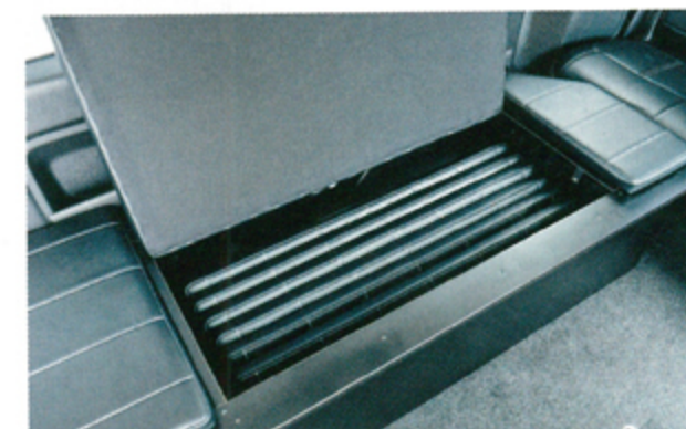
●ベッドマットは、3列目シート下のボックスにすべてスッキリ収納できる。マット自体も軽量設計なので、女性でも簡単にベッドアレンジができる