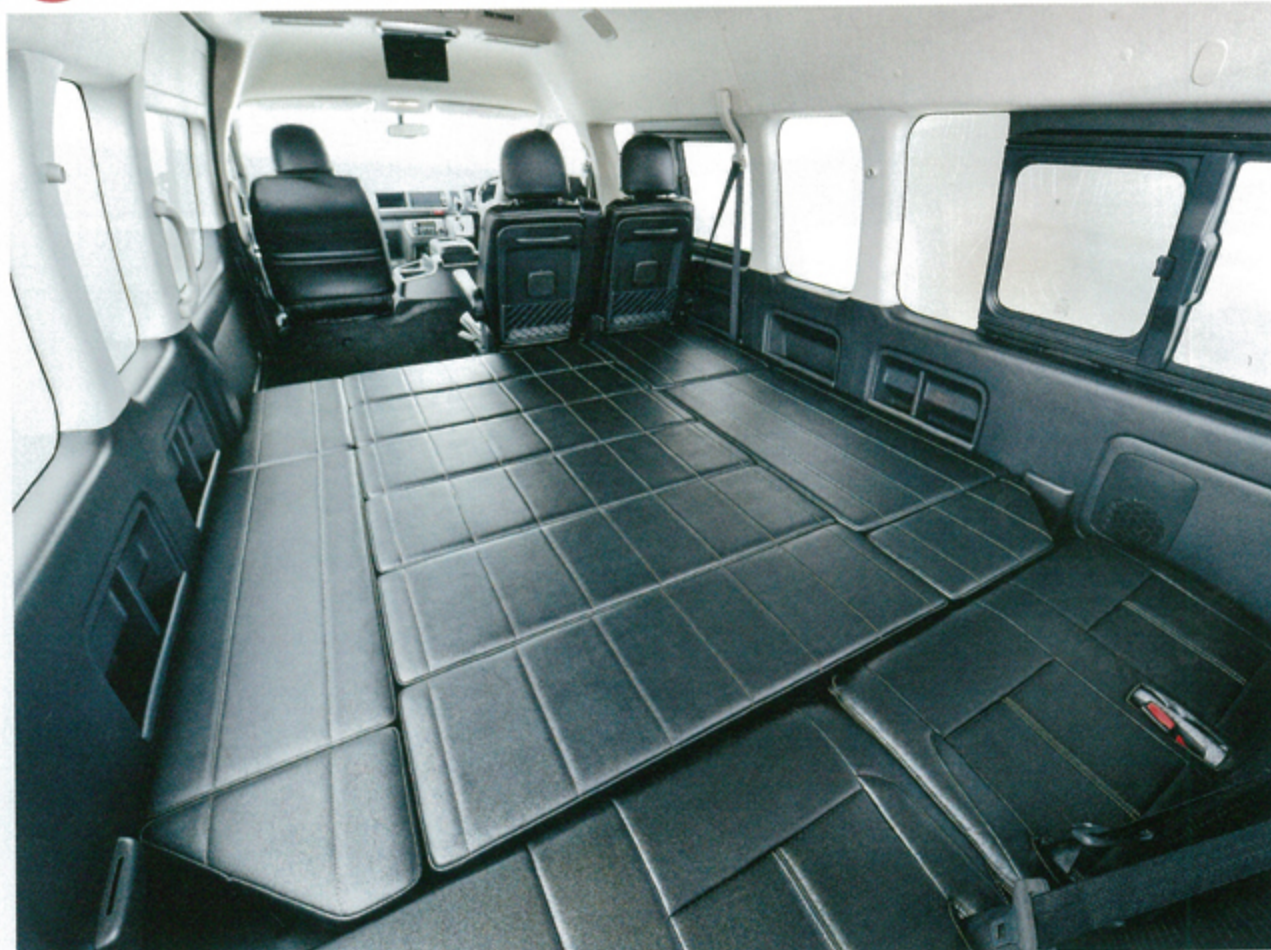
●中央に補助マットをセットするだけでフルベッドへとアレンジできる。サイズは長さ2150mm×幅1700mmなので、ファミリーユースにも最適といえる