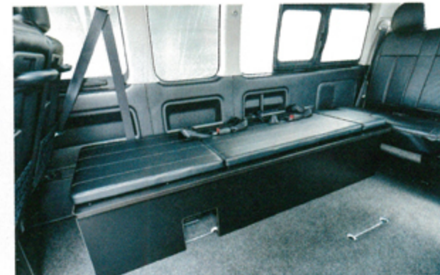
●3列目は2人分の横座りシートを設定。なお、2016年7月以降は法改正でオプションのシートベルトが必要になるので、購入検討中の人はお早めに！