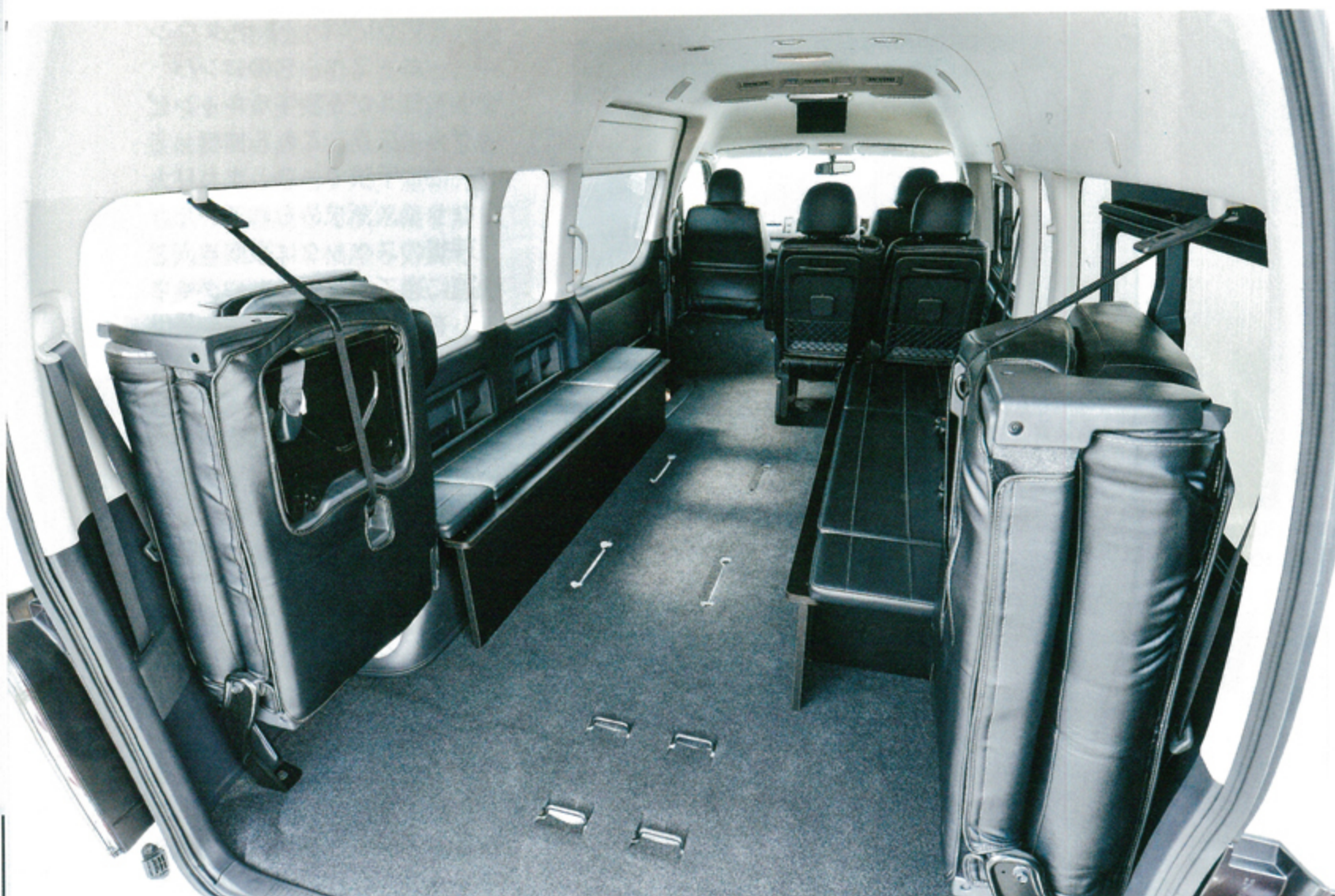
●純正最後部シートの左右跳ね上げ機構を生かせば、自転車なども楽々積めるトランスポーターへと変身。リヤゲートから前方のエンジン隔壁までの床面にはほぼ障害物もないので、長尺物も楽々搭載できる