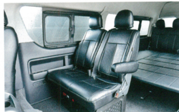
●モデル車はミドルワゴンGL用純正ひじ掛け付きシートにオリジナルカバーを装着した特別仕様。同社は流用品の知識も豊富なので相談してみよう